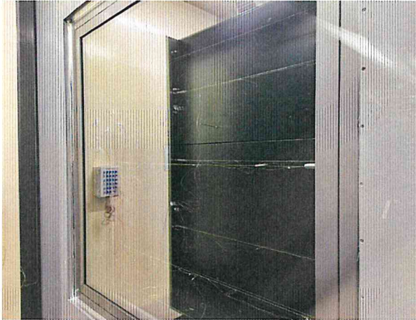
단열성 - 저온실측 사진