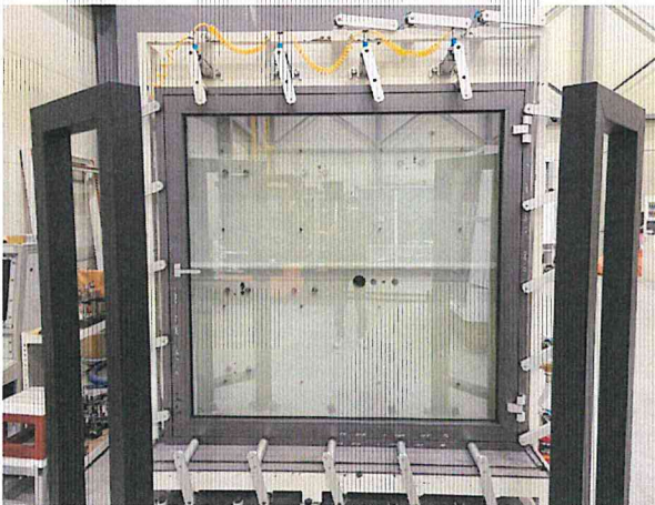
기밀성 - 정면 사진