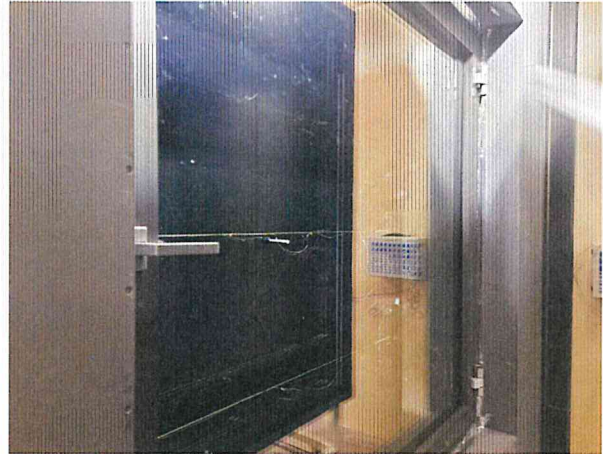
단열성 - 항온실측 사진