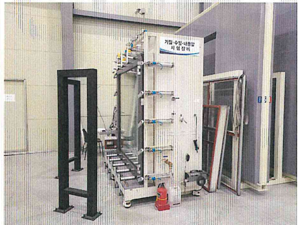
기밀성 - 측면 사진